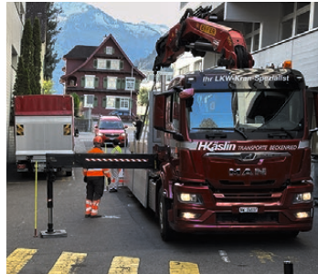
Gleichzeitig ist dies eine gefährliche Durchfahrtsstrasse, was das Be- und Entladen erschwert.