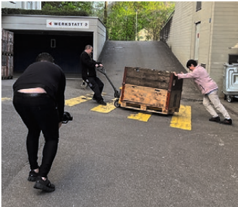
Der Boden vor der Spedition in der alten Werkstätte der Stiftung Weidli Stans ist schräg, alles rollt davon.